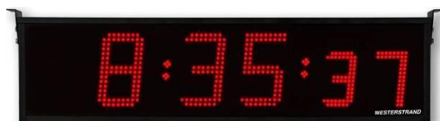
Version heures, minutes et secondes